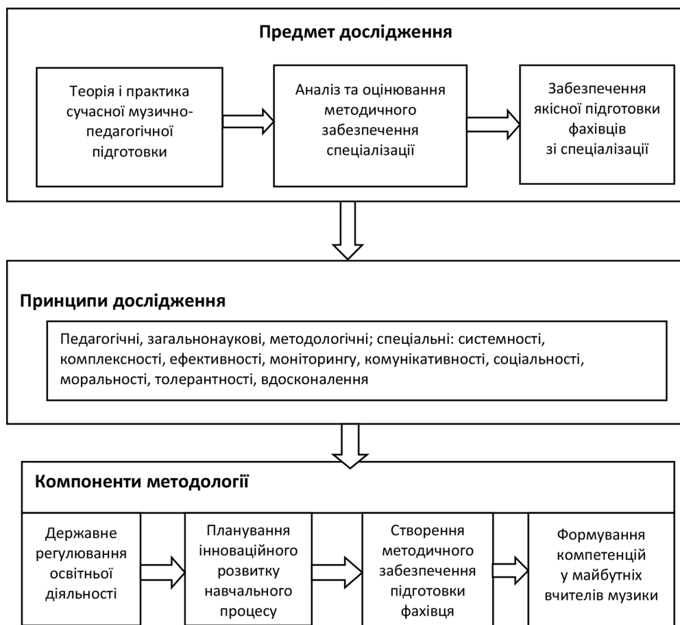
Рис. 1. Структурна схема методології дослідження науково-практичної проблеми «Підготовка вчителів музики у ЗВО України» (авторська розробка)

Структурна схема методології дослідження наукової проблеми «Підготовка вчителів музики у ЗВО України» зображено рис. 1 . Вона містить предмет дослідження, наукові підходи, компоненти методології. Предмет дослідження становить теорія і практика сучасної музично-педагогічної підготовки, аналіз стану методичного забезпечення у закладах вищої освіти, забезпечення якісної підготовки фахівців. Компонентами методології визначено: державне регулювання освітньої діяльності, планування інноваційного розвитку навчального процесу, створення методичного забезпечення підготовки фахівця, формування компетенцій у майбутніх учителів музики.